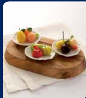
ขนมลูกขลุบ