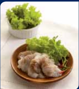
ข้าวเกรียบปากหม้อ