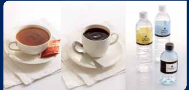
ชา/กาแฟ/น้ำดื่ม