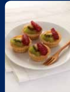
ทาร์ตผลไม้