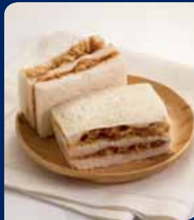
แซนด์วิชไก่ทรงเครื่อง