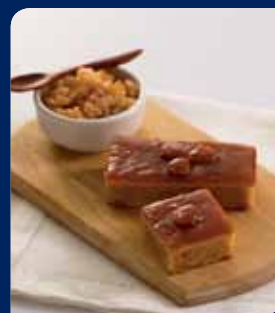
เค้กมะตูม