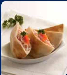
พายโก๋หมูอัด