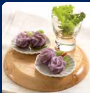
ช่อม่วงอีสาน