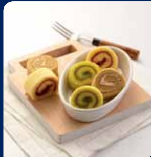
โรลคัสซ่า