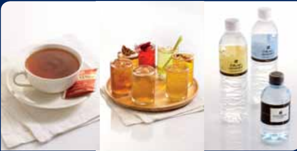
ชาผลไม้/น้ำสมุนไพรร้อน-เย็น/น้ำดื่ม