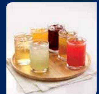
น้ำผลไม้