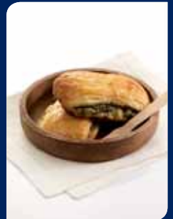
เดนิชพิซซ่า