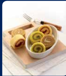
กาแฟ/ชา/กาแฟ/เยลลี่