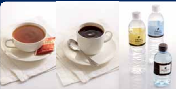
ชากาแฟ/น้ำดื่ม