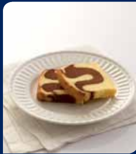
ชีสโกแลตแตรนีสเค้ก