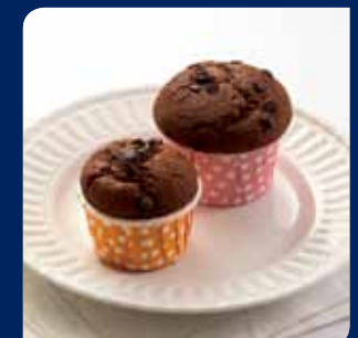
บิสกิต/แมฟฟิน