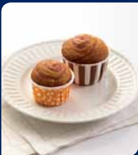
บลูเบอร์รี่พัพ/ราสเบอร์รี่พัพ