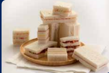
แซนด์วิชไส้ครีม/ปูอัด/ทูน่า/แฮม (เลือก 1 อย่าง)