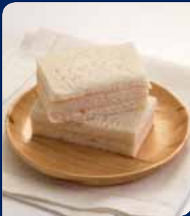
แซนด์วิชไก่รมควัน