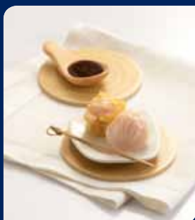
ขนมจับ-ฮงก้า