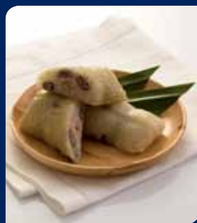
ข้าวต้มมัด