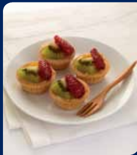
ทาร์ตผลไม้