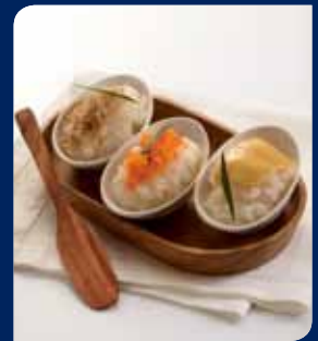
ข้าวเหนียวทอดน้ำกุ้ง / สังขยา