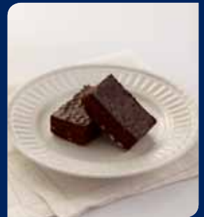
ชีสโกโก้และชเวตตี้