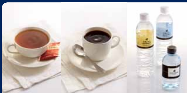
ชา/กาแฟ/น้ำดื่ม