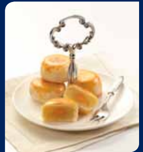
ขนมเปียกเหลือง