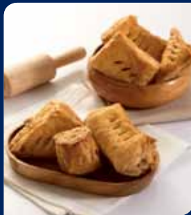
พายโก๋ครีมชอสชา