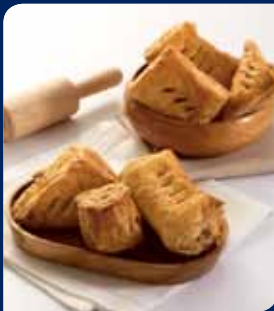
มีนพายโก๋/มีนพิซซ่า