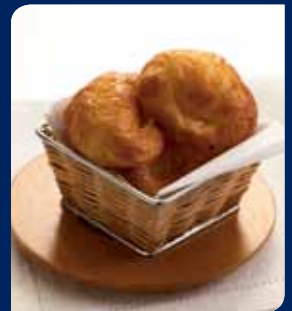
มีนครัวซองต์โฮม/ทูน่า/หมูอัด