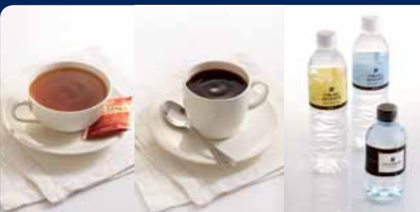
ชา/กาแฟ/น้ำดื่ม