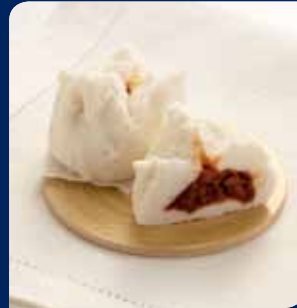
ชาลาป๋าสีสานแดง