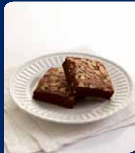
อัลมอนต์บราวน์