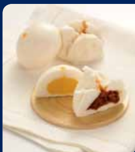
ชลาเปโกลีคริม/หมูแดง