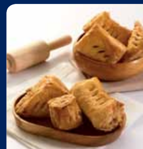
มีนักรัชมังโก้/มัทรี/บิสกิต (เลือก 1 อย่าง)