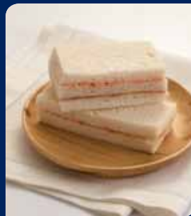
แซลมอนแซนด์วิช