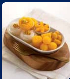
รังไหมไข่กบ/ขนมไทย