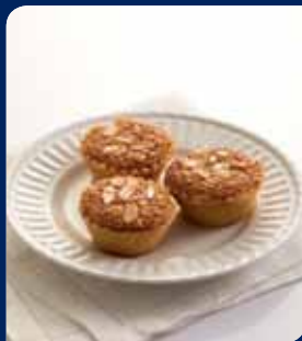
อัลมอนต์เค้