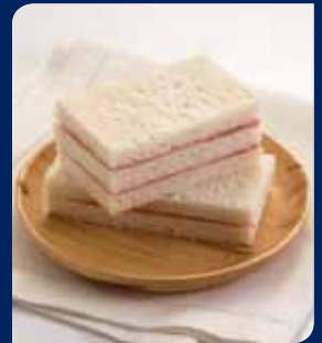
แซนด์วิชแฮม