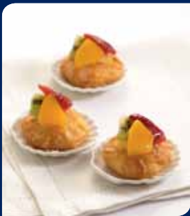
เดนิชผลไม้