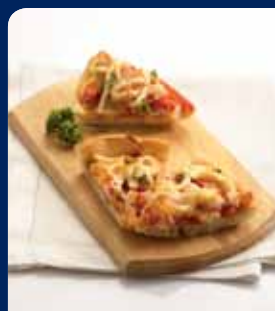
มินิพิซซ่า