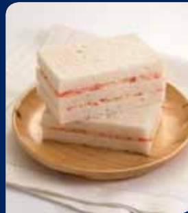
แซนด์วิชหมูอัด