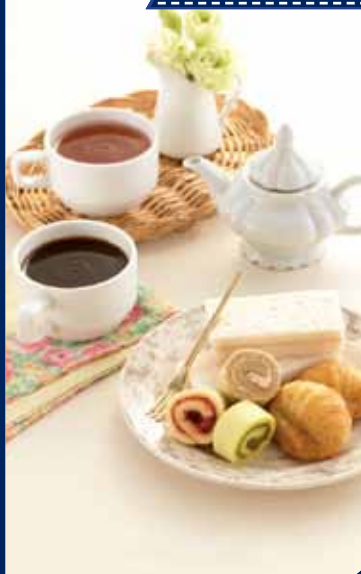
Cake & Bake