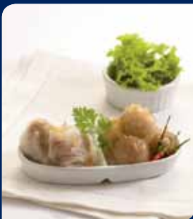
สาหร่ายสด