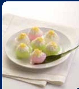
ขนมต้มกลิ้ง