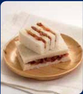
แซนด์วิชหมูหยองน้ำพริกเผา