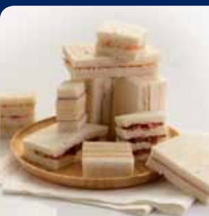
แซนด์วิชไส้ครีม/ปูอัด/ทูน่า/แฮม (เลือก 1 อย่าง)