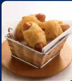
มีนเตมึ่เสิร์ฟร้อน