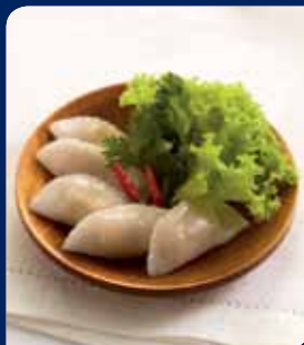
บับสันนึ่งไส้ไก่