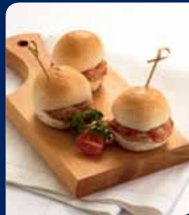
มีนเบอร์เกอร์หมู/ไก่