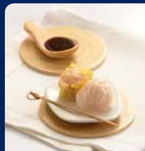
ชนมจับ/ฮะก๋า