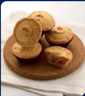
พายสุ่งโก๋