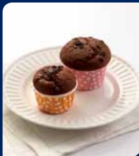
ชีสโกโก้และพัพ