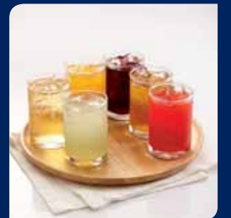
น้ำผลไม้