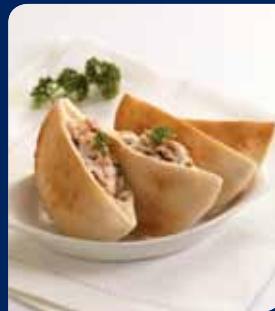
พายโก๋หมูหม่า