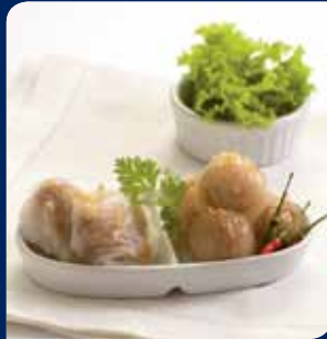
สาเก้อีสาน