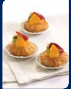
เดนิชผลไม้