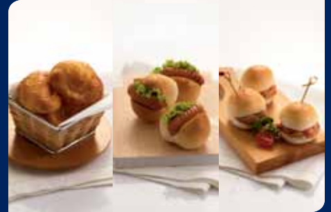
มีนักรัชมังโก้/มัทรี/บิสกิต/โรล/ขนมปังอบสด (เลือก 1 อย่าง)