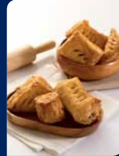
มีดพิซซ่า