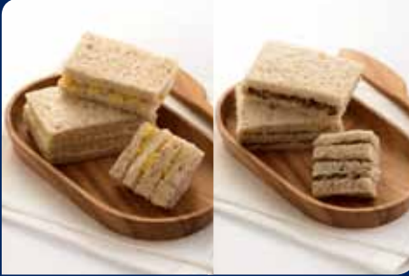
แซนด์วิชข้าวโพด/เห็ด : ขนมปังโฮลธัญ/ขนมปังธัญพืช (เลือก 1 อย่าง)

CATERMAN ไม่พลาดที่จะเอาใจกลุ่มผู้รักสุขภาพ ด้วย การบริการจัดเสิร์ฟเครื่องดื่ม พร้อมอาหารว่างเพื่อ สุขภาพ ที่ใส่ใจตั้งแต่การคัดเลือกวัตถุดิบแลแพคเกจจิ้งใน การส่งบรรจุภัณฑ์เป็นมิตรต่อสิ่งแวดล้อม