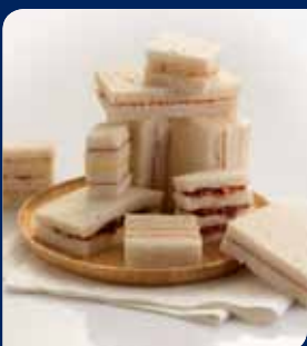
ทริเชนดิวซ์