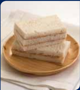
แซนด์วิชทูน่า